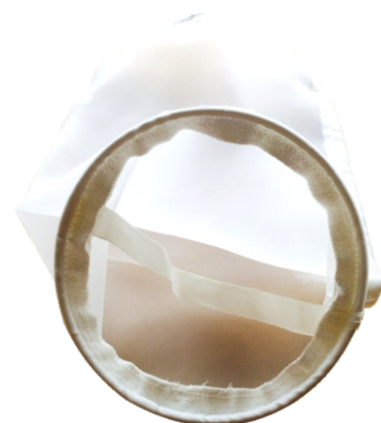
Metal ring style