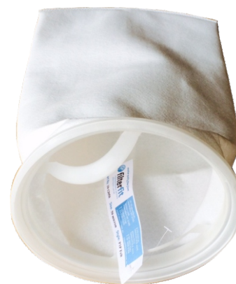
Plastic top style