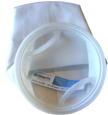
Plastic top style