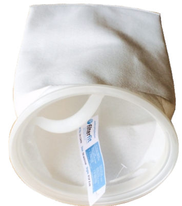
Plastic top style