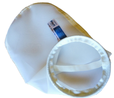
Plastic top style