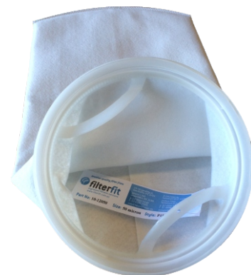
Plastic top style